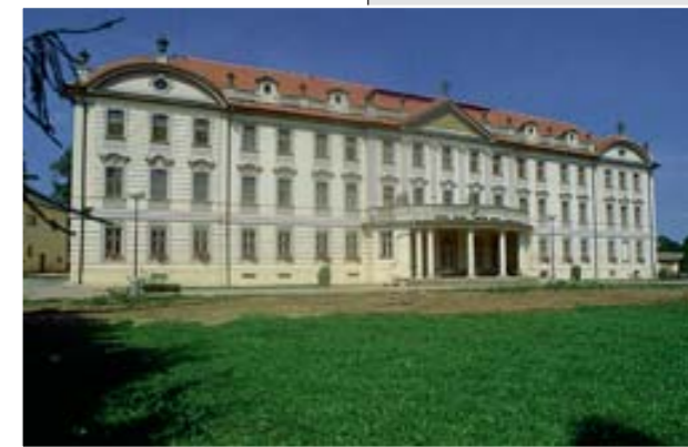
Zámek v Tloskově u Neveklova býval sídlem pánů Hodějovských z Hodějova, kteří patřili k vůdcům protibabsburského stavovského povstání v letech 1618–20. Udržovaný objekt uprostřed parku dnes slouží jako dětský domov.