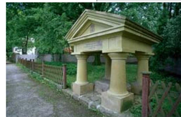
Pod tímto klasicistním náhrobkem v Neumětelích prý odpočívá bájný Šemík, který svého pána Horymíra zachránil před smrtí odvážným skokem přes vyšehradské hrady do Vltavy.

Později však Neveklov o svá městská práva přišel, protože v r. 1563 se dočkal nového povýšení, tentokrát však pouze na městečko. Důležité dopravní cesty se obci vyhýbaly a tak zůstávala chudá, bez významnějšího průmyslu. Smutný osud potkal Neveklov za 2. svět. války. V r. 1942 bylo totiž celé Neveklovsko mezi Vltavou a Sázavou až k Sedlčanům násilně vystěhováno, aby tu mohlo být zřízeno vojenské cvičiště zbraní SS. Tuto událost připomíná pomník z r. 1983. Kostel sv. Havla byl původně gotický, zbarokizovaný ve 2. pol. 17. stol. Je obelhnán zde se dvěma barokními branami, u západní brány se dochovaly náhrobní kameny z let 1524 a 1664. Poblíž stojí barokní fara, pod koste-