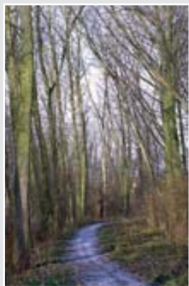
V těsné blízkosti Neratovic leží přírodní rezervace Černínovsko se starými lesními porosty a vzácnou květenou.