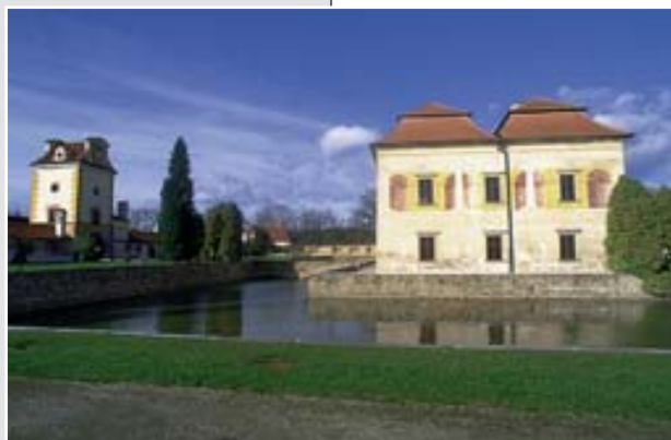
Renesanční zámek Kratochvíle u Netolic sloužil Vilémovi z Rožmberka jako lovecký letohrádek. Půvabná stavba uprostřed parku patří k nejobdivnějších renesančním stavbám v západních zemích. V interiérech je stálá expozice Historie animovaného filmu.