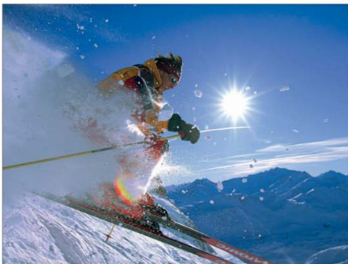
Lyžování v oblasti Sankt Antonu am Arlberg