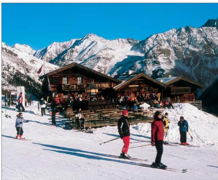
Na sjezdovce v Söldenu