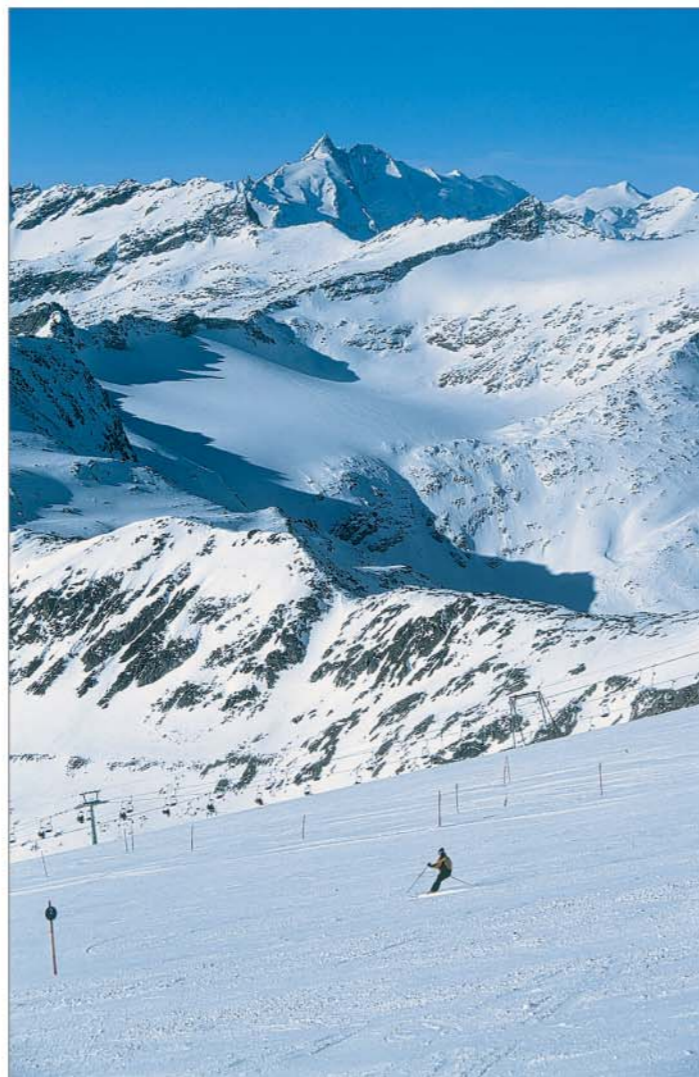
Mölltalský ledovec – v pozadí Grossglockner