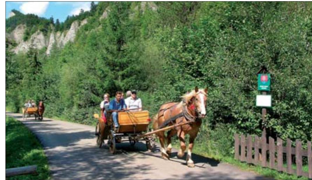
Pieniny – projížďky bryčkou

Vysoké Tatry: Štrbské Pleso (jednodenní výstupy na Solisko, Kriváň, Rysy), Starý Smokovec (např. ke Studenovodským vodopádům), Tatranská Lom-