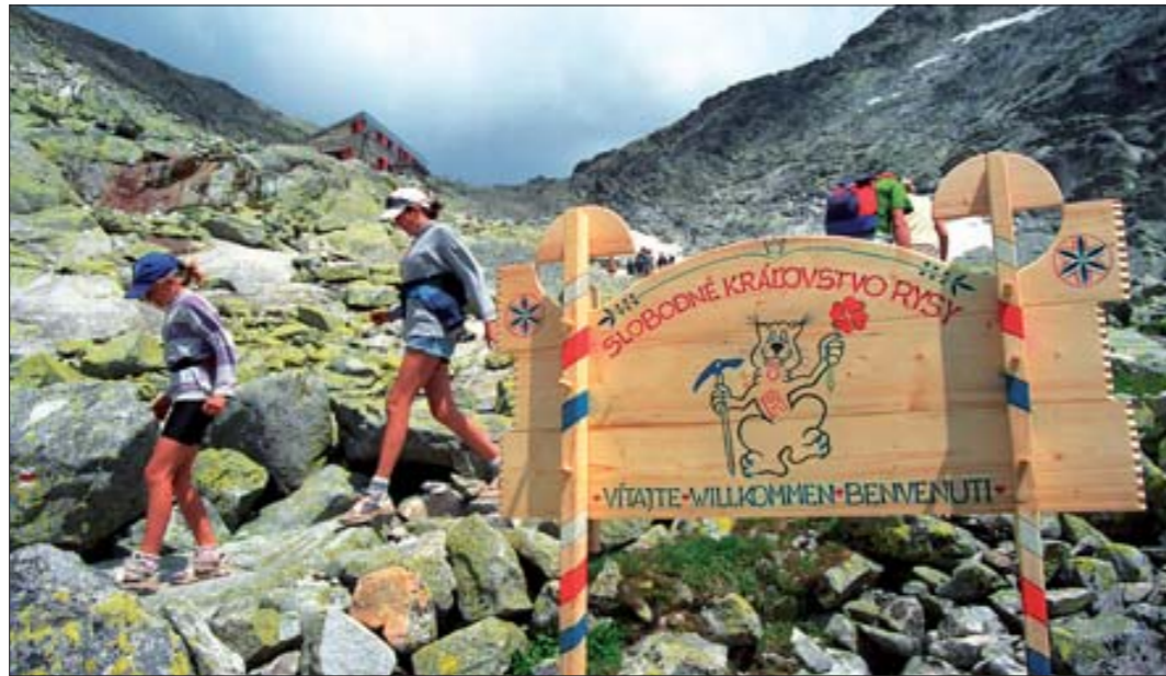
Pěší turistika ve Vysokých Tatrách

Stejně jako u nás, i na Slovensku jsou turistické trasy značeny pomocí značek ve standardizované podobě čtverce o velikosti přibližně 10 x 10 cm, děleného na tři pruhy – oba krajní jsou bílé, prostřední je pak v jedné ze čtyř vodičích barev (červená, modrá, zelená a žlutá). Vedle toho existuje ještě poměrně pestrá nabídka různých odboček (k jeskyni, chatě, studánce apod.), opět v barvě značky a s bílým okrajem. Značky jsou kreslené podle státní normy a chráněné zákonem, ale jejich poškozování je (bohužel) poměrně časté a pachatelé prakticky nepostížitelní. Stejně jako ve většině evropských zemí (na rozdíl od Česka), údaje o vzdálenostech na rozcestnicích nejsou v kilometrech, ale v hodinách , což je zejména v obtížném horském terénu výrazně praktičtější. Časové údaje jsou ovšem poměrně často dost optimistické. Středně zkušený turista s batohem na zádech má obvykle co dělat, aby příslušnou trasu za udávaný čas ušel. Oproti českým ze-