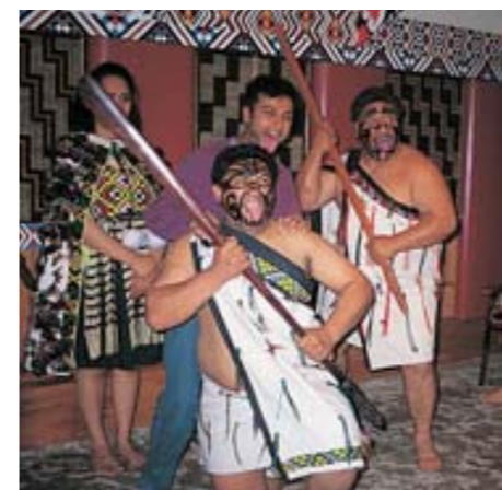
Maorské představení pro turisty

47°17' až 34°09' j. z. š., 166°25' až 178°35' v. z. d.