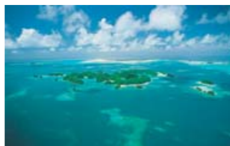
Korálové atoly

• historie: V r. 1543 byly ostrovy objeveny Španěly. Do r. 1899 byly jejich kolonií, poté patřily Německu. V l. 1914 – 1944 byly obsazeny Japonskem. Ještě v témže roce je dobyli Američané a od r. 1947 byly jimi spravovány jako součást světeckého území OSN. Od r. 1981 samosprávná Palauská republika, nezávislost od 1. 10. 1994.