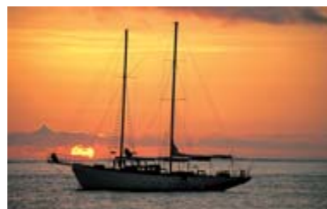
Západ slunce

rov. V l. 1888–1919 byl německou kolonií. V r. 1920 byl svěřen jako mandátní území Společnosti národů pod správu Velké Británie, Nového Zélandu a Austrálie. V l. 1942 až 1945 byl okupován Japonskem. V l. 1947–1968 byl spravován Británií, Novým Zélandem a Austrálií jako poručenské území OSN. Dne 31. 1. 1968 získal plnou nezávislost.