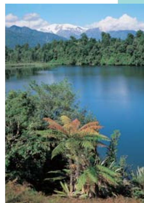
Alpy na Jižním ostrově