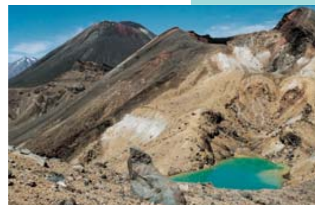
Tongariro N. P. – v pozadí hora Ngauruhoe

rozloha: 270 534 km 2 počet obyvatel: 3 994 000 (2004) hlavní město: Wellington státní zřízení: konstituční monarchie v rámci Commonwealthu úřední jazyk: angličtina, maorština měna: 1 novozélandský dolar (NZD) = 100 centů nejvyšší bod: Mount Cook (Aorangi) 3764 m n. m. nejnižší bod: Tichý oceán 0 m n. m. HNP/obyv.: 15 870 USD (2003) náboženství: bez vyznání 20 %, anglikáni 17 %, presbyteriáni 13 %, římská katolická 13 % očekávaná délka života při narození: 81,8 let (Ž), 75,7 let (M) (2004) průměrný roční přírůstek obyvatelstva: 1,1 % (2004) členství v mezinár. org.: OSN, OECD, Commonwealth