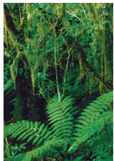
Deštný prales